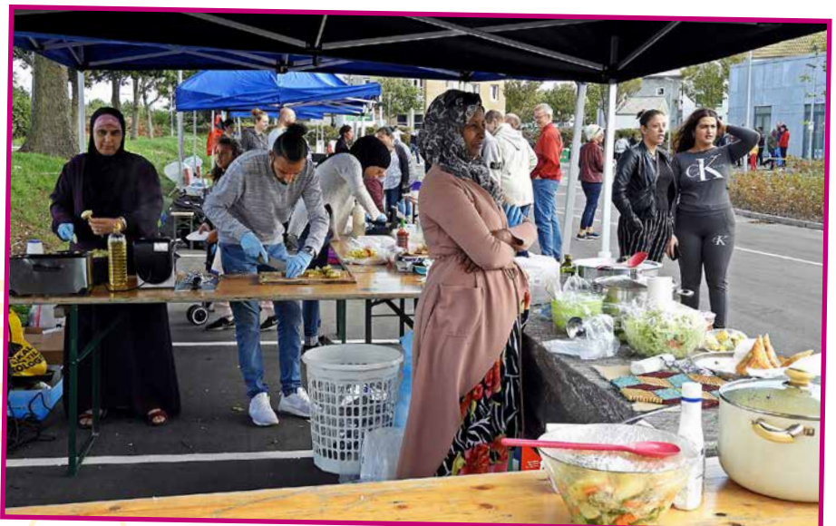
Der var traditionen tro stor opbakning til Bazardagen, og der var mange spændende ting at købe i boderne

ikke mindst en lang række frivillige der hjalp med alt fra opsætning af pladsen til ansigtsmaling.