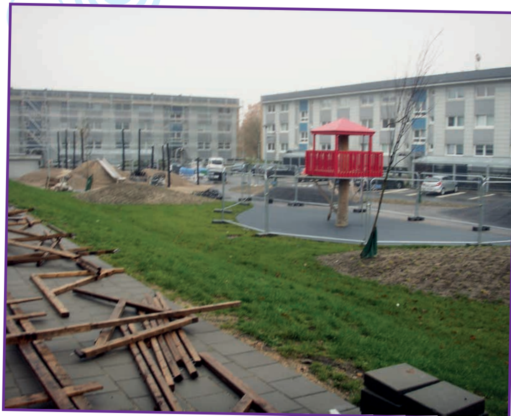
De nyanlagte gårdrum på Stengårdsvej er ved at tage form.

Men det er først og fremmest udearealerne, der er rykket på her i efterårsmånederne, de første 4 gårdrum er ved at være færdige, og efterhånden kan man danne sig et billede af, hvordan det bliver, når det hele står færdigt.