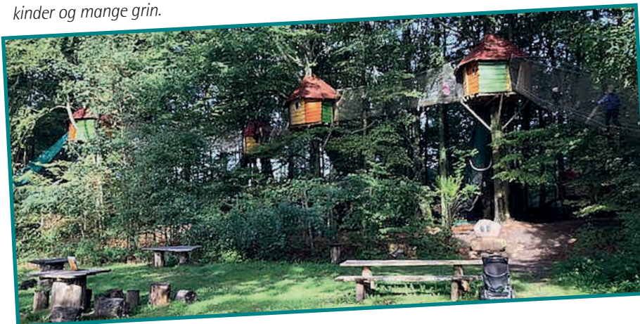
Der var mange spændende legemuligheder.

Lørdag den 15. september tog 14 forventningsfulde børn og 13 lige så spændte voksne af sted på den årlige børnetur for afd. 9, 10, 26 og 29 (Fyrparken) til WOW-Park, der ligger ved Skjern.