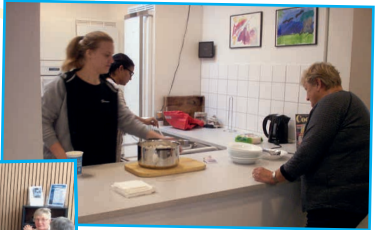
Der serveres chili con carne med ris til de fremmødte.

- Indtil nu tilbereder vi maden, men vi håber, at vi kan få nogle frivillige til at hjælpe os i køkkenet.