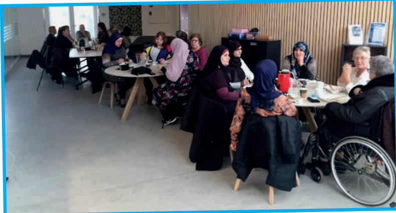
Hyggesnak mens der ventes på maden.

Der er kaffe på kanden, mens du venter på maden, som serveres fra kl. 11.30. Oktober menuen bestod af forskellige lækre supper, i november stod den på gryderetter, og her i december er der julemad.