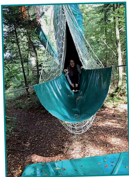
Det blev en fantastisk børnetur med leg, røde kinder og mange grin.

Den årlige børnetur for afdelingerne 9, 10, 26 og 29 gik til WOW parken