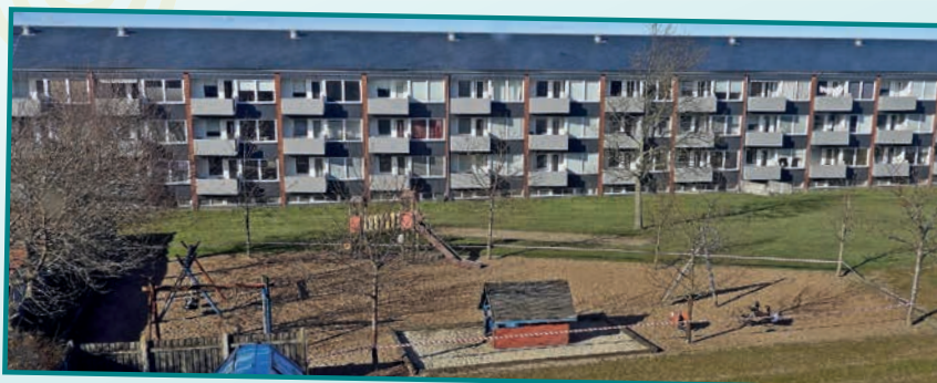
Legepladserne blev hurtigt lukket ned for at undgå, at der samledes for mange børn og forældre. Her er det fra Hermodsvej.

- Jeg synes, medarbejderne har klaret det flot, og de forskellige opgaver blev løst godt, men jeg vil også gerne rose beboerne for stor forståelse for situationen og den store tålmodighed, der blev udvist.