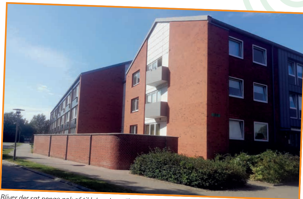
Bliver der sat penge nok af til løbende vedligeholdelse?

Jeg tror ikke, at det altid kun er en billig husleje, der tiltrækker nye lejere, jeg tror også, at det er vedligeholdelse,