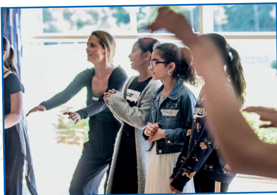
Teatergruppen holdt det første workshop i juni, hvor mange mødte op for at være med. Næste workshop bliver i oktober.

"Næste Station Stengårdsvej" er en del af projekt 6705+Statens Kunstfond, der er et samarbejde mellem Esbjerg Kommune og Statens Kunstfond. Følg med på Facebook, @6705+Statenskunstfond