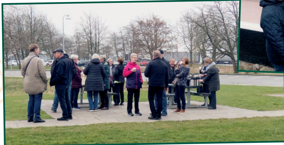
På vej til Ærø.

Desværre var det endnu mere diset og tåget, så der var ikke det bedste udsyn, og vi fik derfor ikke så meget ud af de ellers så smukke steder. Undervejs var der stop ved Uldgården, hvor der kunne købes næsten alt inden for