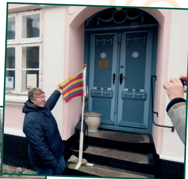
De smukke gamle døre i Ærøskøbing.

husflid. Stedet er meget berømt og alle, der har været på Ærø har vist været forbi der.