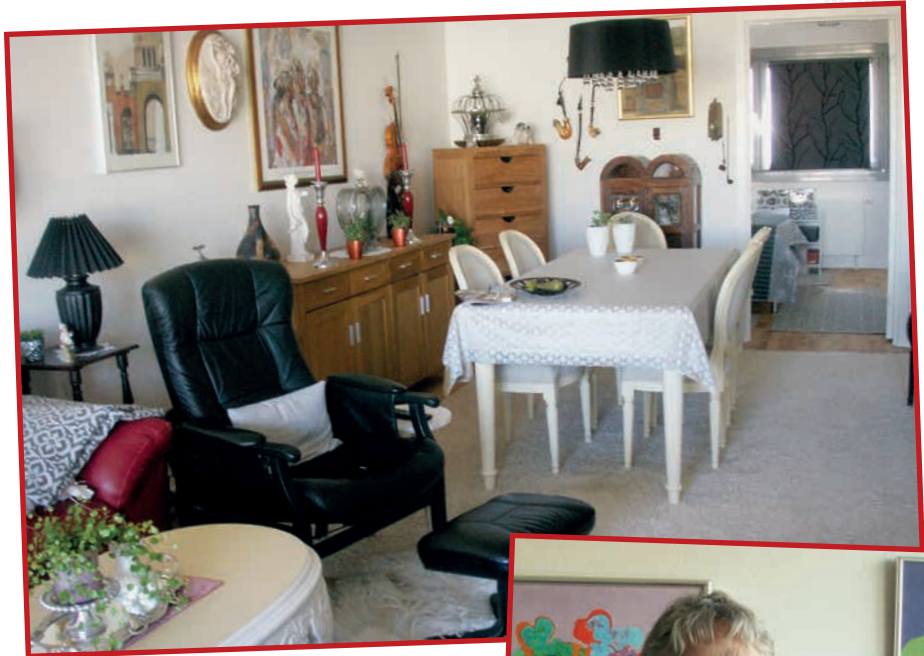
En flot og spændende stue som rummer mange gamle loppefund.